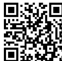
申込用 QR コード