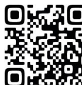
Instagram 用 QR コード