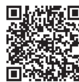
LINE 用 QR コード