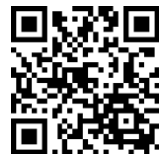
お申し込み用 フォーム

お申し込みでは下欄の項目をお知らせください。なお、電話でのお申し込みはご遠慮ください。